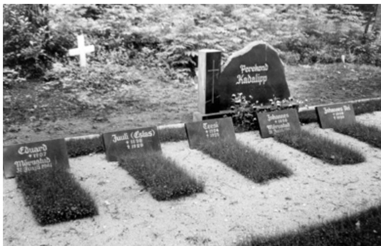
Kadalippude hauaplatsid Türi linnakalmistul 1991. aastal.

Meil on praegu taastatud ja kehtimas Eesti Vabariik, lehvimas sinimustvalge riigilipp, kuid tahaksin hoiatada-öelda: “Inimesed, olge valvsad! See tont pole kadunud veel kuhugi! Neid on miljoneid.”