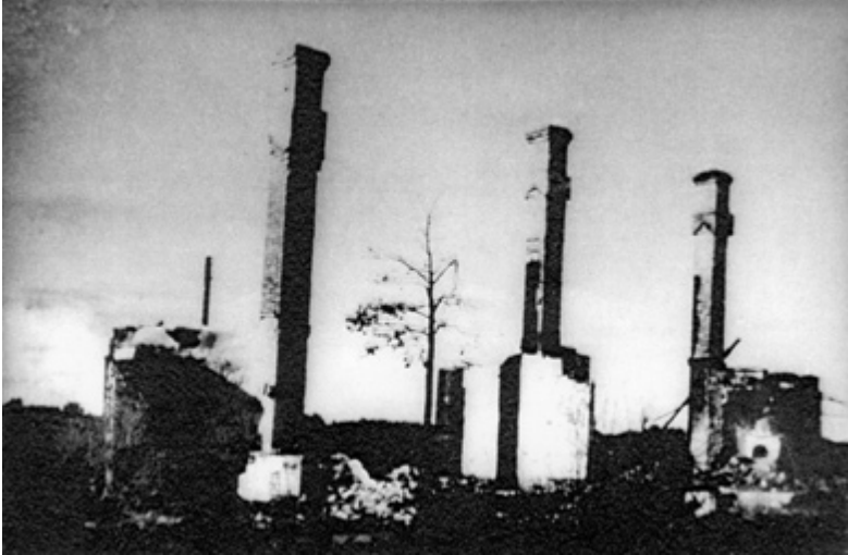
Põletatud kauplus-meierei hoone Karjakülas.