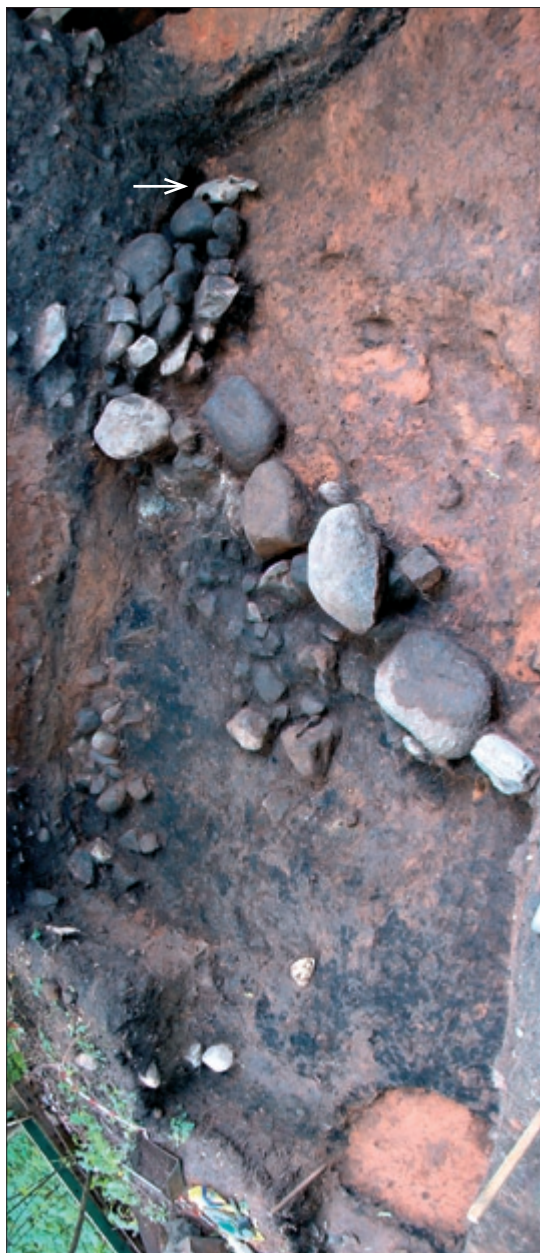
Musumäe Idakaevand: kivivare ja hobusekolju (märgitud noolega) pärast pruuni kihi ärakaevamist. Vaade põhja poolt.