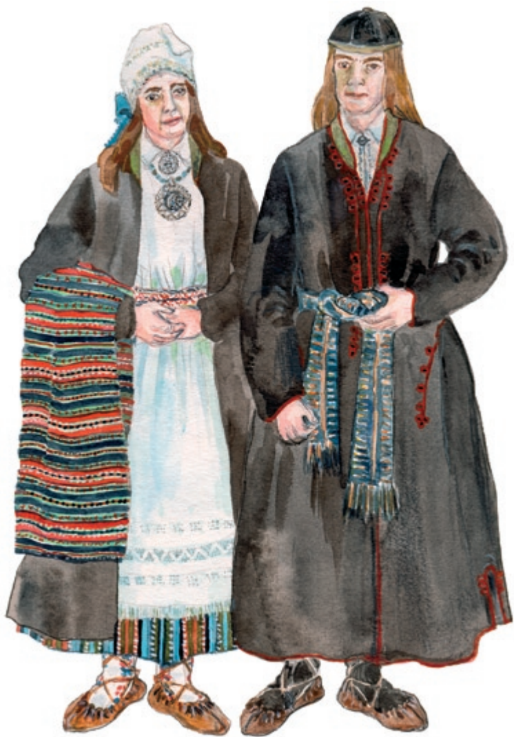
Suure-Jaani naine ja mees 19. saj keskel. Joonistanud Mare Hunt.