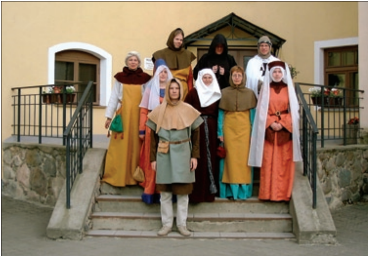
Viljandi Muuseumi töötajad on kogunenud Viljandi hansapäevade avarongkäiguks muuseumi hoovitrepile. Juuni 2004.