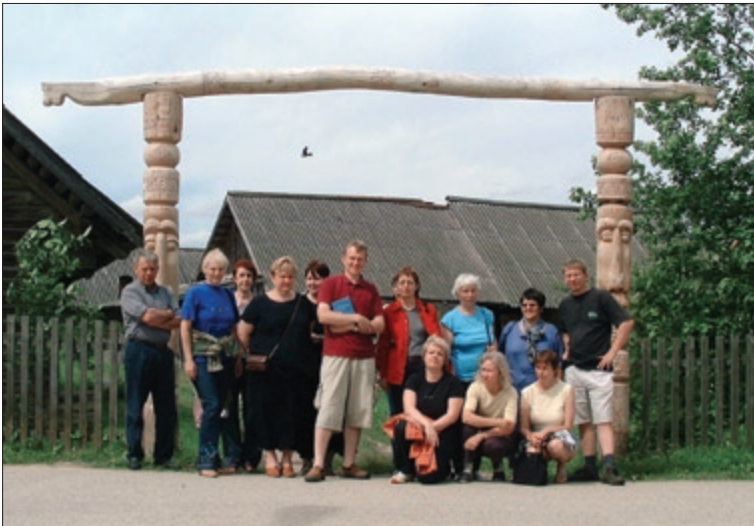
Muuseumipere väljasõidul Setomaale. Juuli 2004.