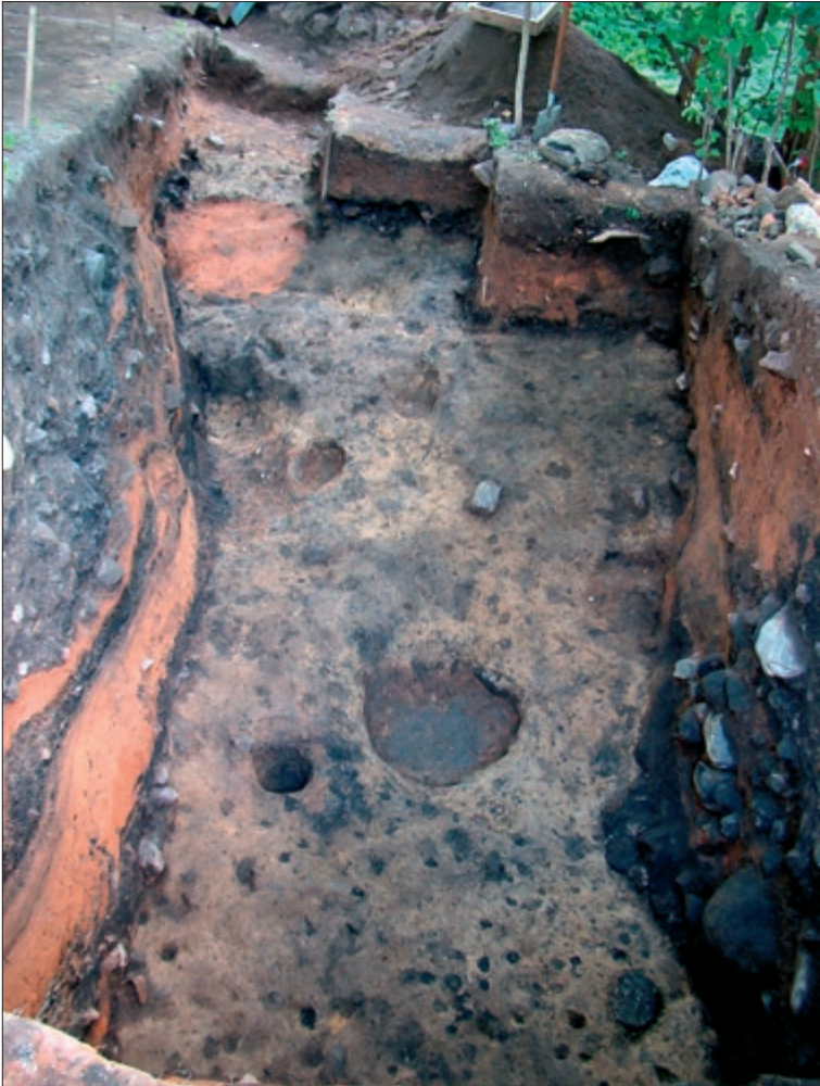
Idakaevandi looduslik aluspõhi. Vaade lääne poolt.