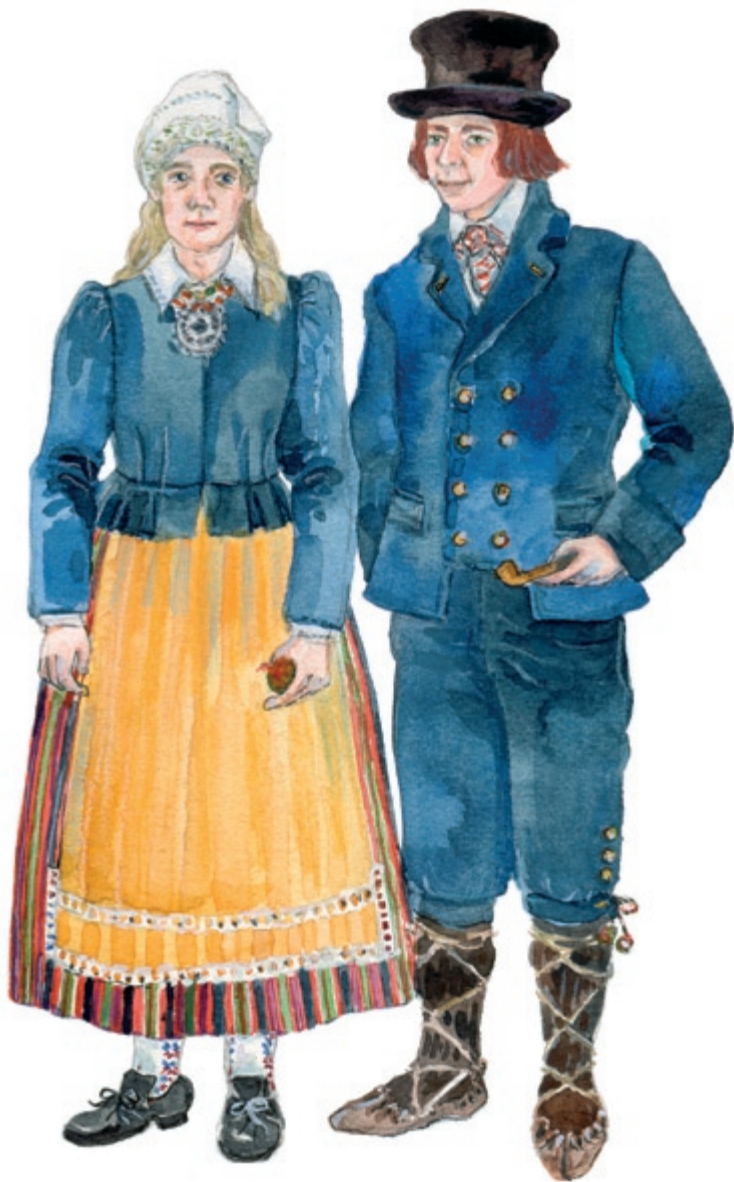
Suure-Jaani naine ja mees 19. saj II poolel. Joonistanud Mare Hunt.