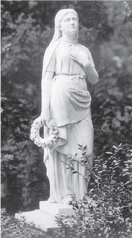
“Lootus” (marmor) Viljandi Vanal kalmistul.

A. Weizenbergi loomingu uurijana olete tema loomingupärandis välja toonud ka viis Viljandiga seotud teost, neli neist on kalmistuskulptuurid. 1893. aastal on valminud hauaskulptuur “Lootus”. Üle 100 aasta tagasi loodud teosel on täna kindlasti hoopis teine tähendus ja mõju. Milline?