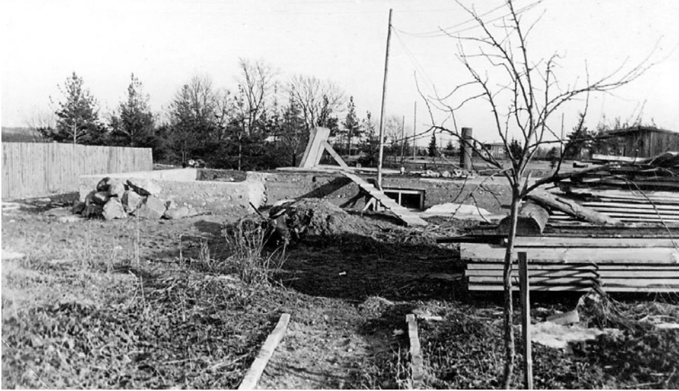
Valminud on keldrikorrus.