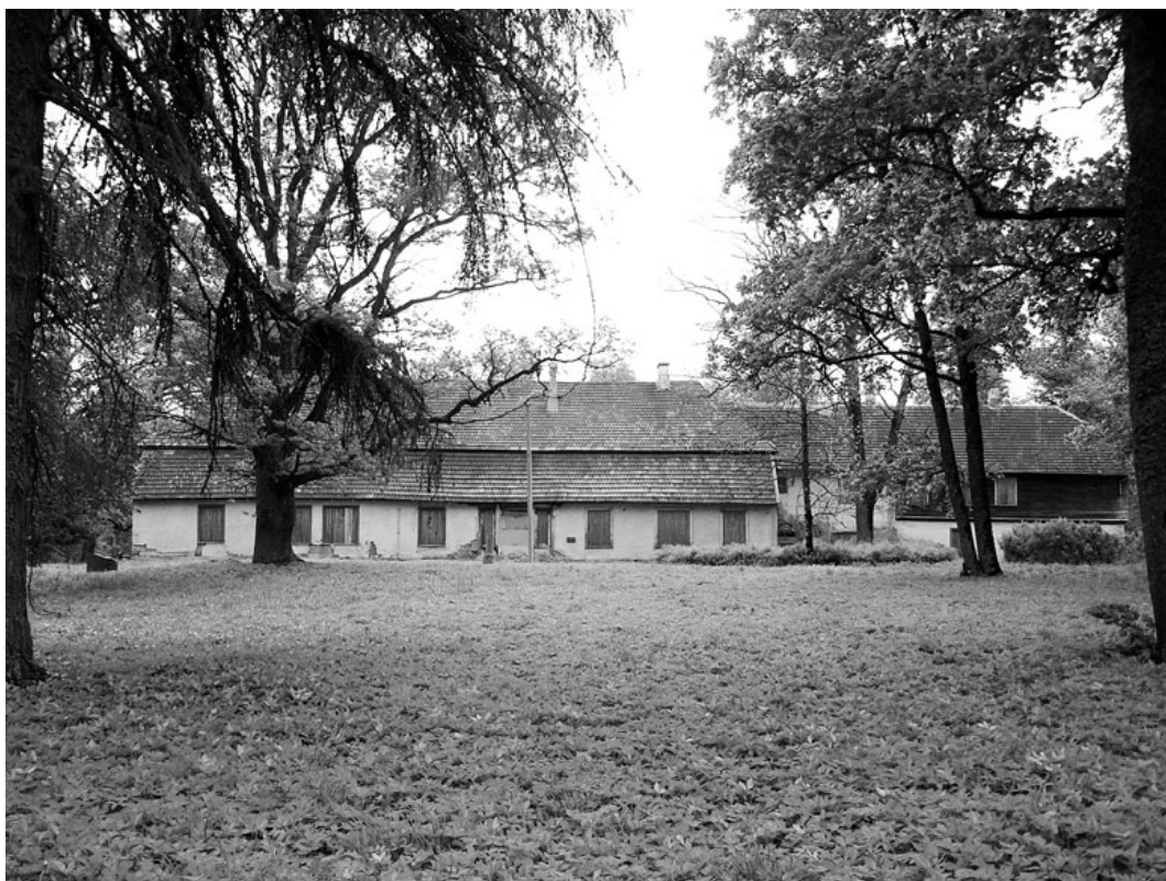
Loodi mõisa peahoone juunis 2011.