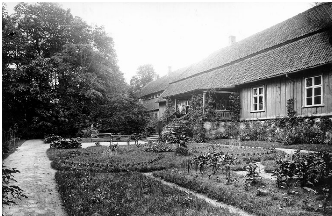
Loodi mõis juunis 1912. VMF 424:307/8152.