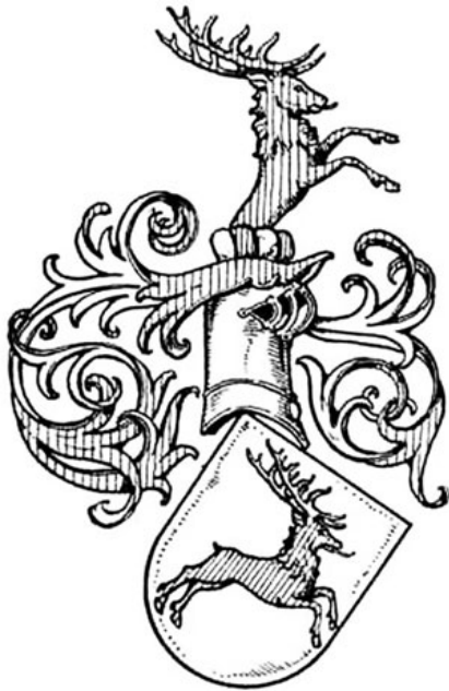
Von Bockide vapp.