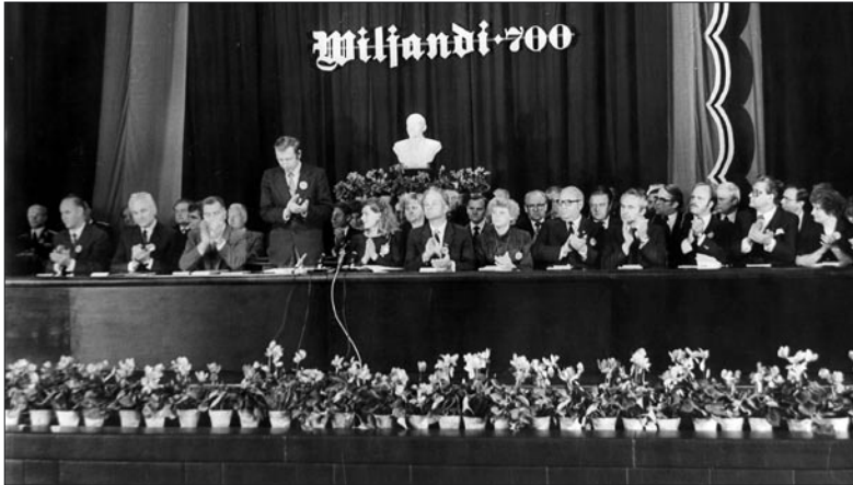
Plenaaristungi presiidium. Ugala, 23. september 1983.

Muidugi juhtus ka seda, et nõutavat heledat kollakat või valget tooni Tallinna laos ei olnud ning selle asemel saadeti näiteks pruunikaspu-nast või sinist, mida laos oli ja ilmselt ei tahetud Tallinnas kasutada.