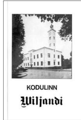
Kogumiku “Kodulinn Viljandi” esikaas.

3-liikmeline delegatsioon ja Porvoo meeskoor “Porvoon Mieslaulajat” (60 liiget).” (VLMA f. 846, n. 23, s. 993). See oli juba rahvusvaheline tasand, ehkki ühingu NSVL-Soome vahendusel. Viljandi linna juubeli tähistamise ajakavasse oli haaratud ka Madisepäeva lahingu mälestuslõke, mis süüdati 21. septembril 1983 kell 20.00 Vanamõisa väljal.