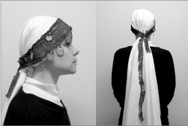
Joonis 1–2. Peahe Erreste aardest (AI 739).

veel kullassepatooteid(!). Eriti tähelepanuväärne on Erreste aare, kus on muuhulgas ka üks Uue-Pornuse mõisniku vapiga importlusikas. Väga tõenäoline, et need aardeleiud kuuluvadki teistest mõnevõrra jõukamatele ühiskonnaliikmetele. Kas aga müntidega peahted võiksid seega osutada mingisugusele kõrgemale staatusele? 7 See küsimus jääb hetkel veel vastusetta.