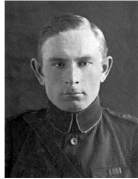
UKU TIKKAR VR II/3

Autasumaa suurusega 22,83 hektarit eraldati Viljandimaa Adavere mõisast mais 1921. Tamme taluks ristitud maal asuvad mõisaaegsed hooned ostis ära oktoobris 1927. Koht kinnistati tema nimele oktoobris 1927. Ekslikult määrati autasumaa talle kahel korral. Aprillis 1927 tühistati Vabariigi Valitsuse otsusega 19. novembrist 1920 pärit esimene