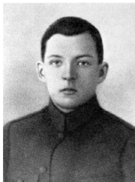
ARNOLD NIGGOL VR II/3

Nimi on Põltsamaa sambal ning oli tõenäoliselt ka Põltsamaa kirikus asunud mälestustahvilil.