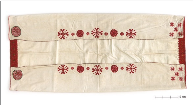
Tarvastu tanu II arengujärk (VM 4307/E 86).