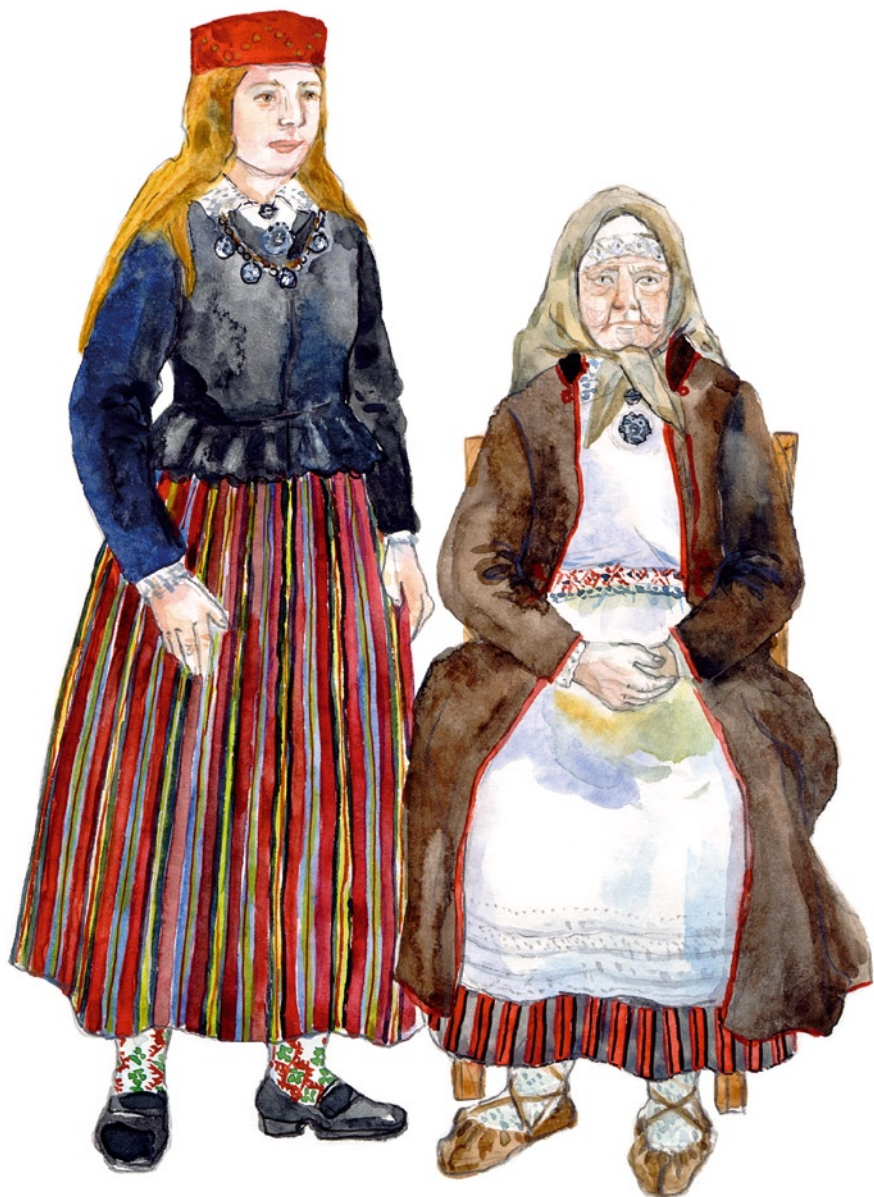
Kolga-Jaani naine ja eit 19. saj keskel. Joonistanud Mare Hunt.