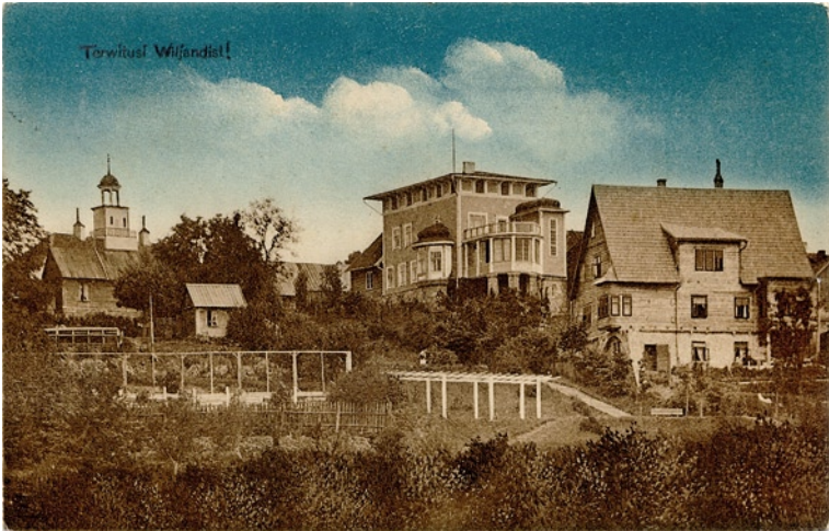
Trepimägi, u 1910. a, H. Leoke (OB.K 95).