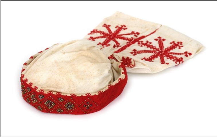
Tarvastu tanu III arengujärk (VM 1173/E 284).