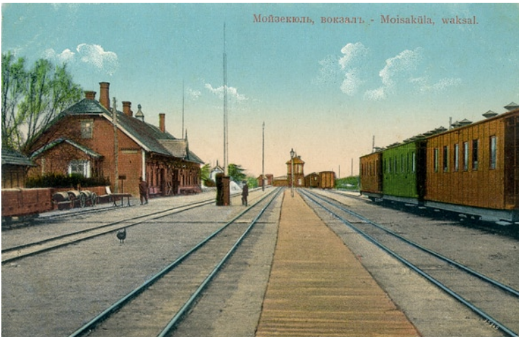
Mõisaküla raudteejaam, u 1910. a, M. Luik (OB.K 21-2).