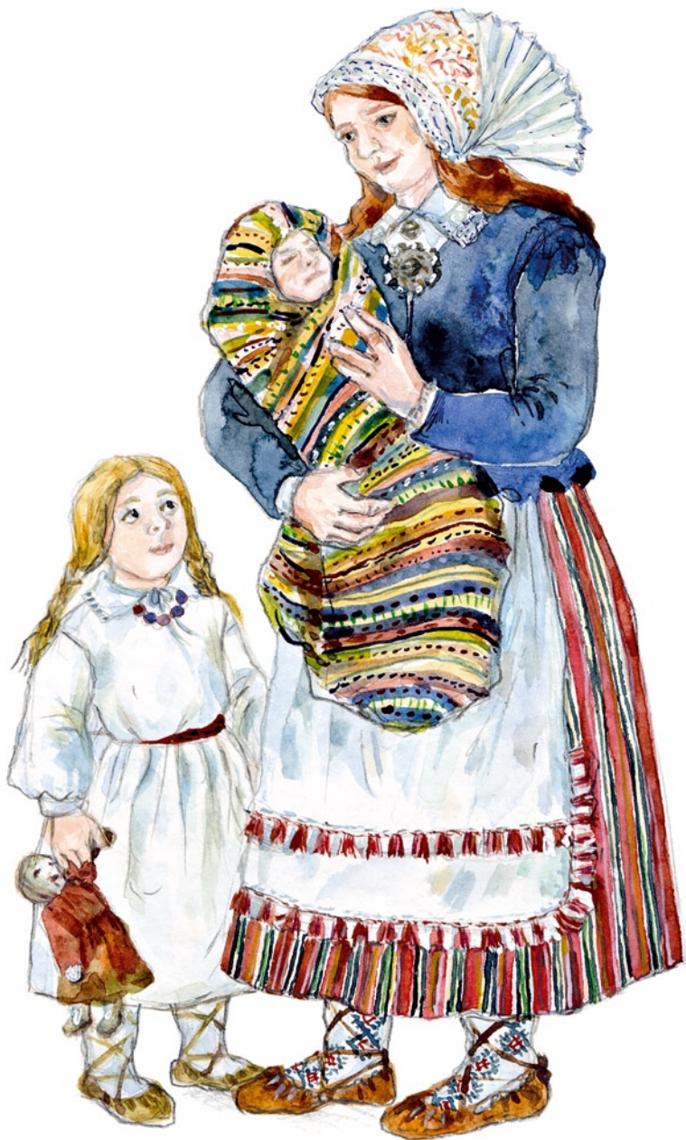
Kolga-Jaani naine lastega 19. saj keskel. Joonistanud Mare Hunt.