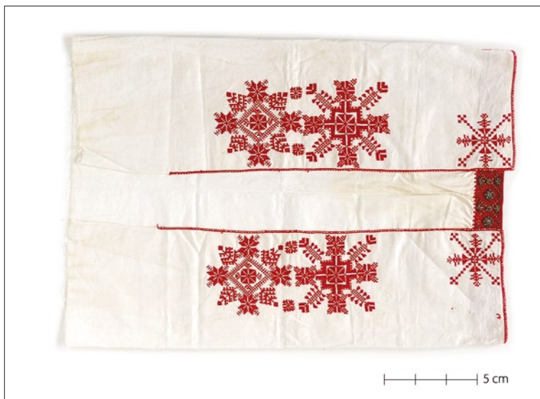
Tarvastu tanu III arengujärk (VM 2355/E 291).