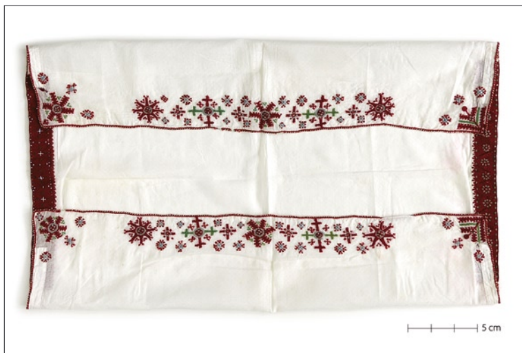
Tarvastu tanu II arengujärk (VM 6033/E 288).