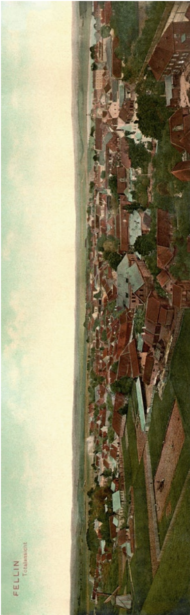
Üldvaade Viljandi linnale Maakiriku tornist, u 1907. a, E. Ring (VM 482).