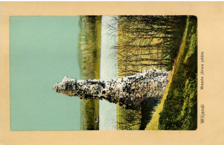
Waeade järve pääle