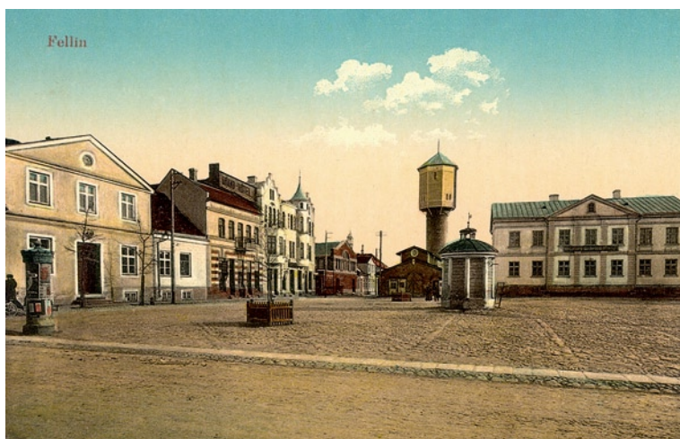
Viljandi turuplats, u 1915. a, E. Ring (VM 4849 F 177/1043).