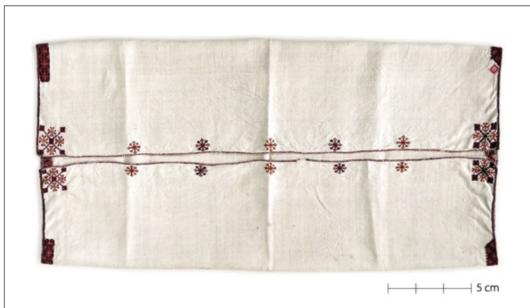
Tarvastu tanu I arengujärk (VM 400/E 85).