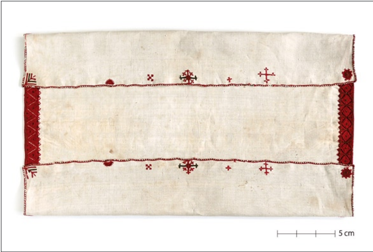
Tarvastu tanu I arengujärk (VM 3543/E 286).