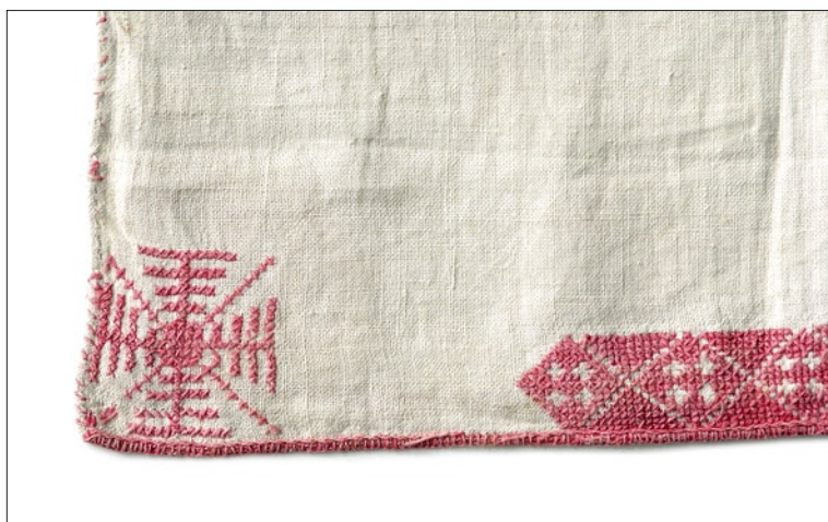
Tarvastu tanu I arengujärk (VM 2070/E 7).