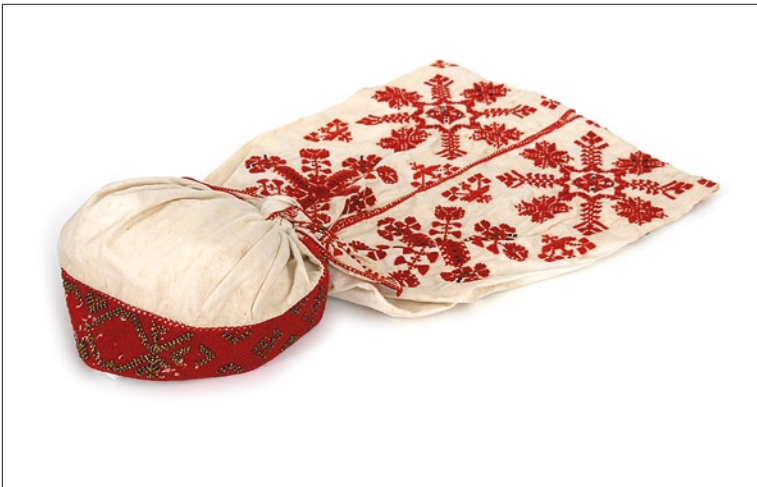
Tarvastu tanu III arengujärk (VM 326/E 3).