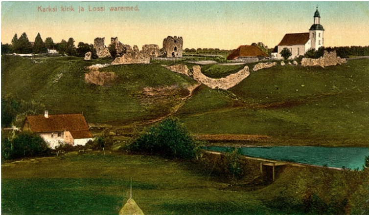
Karksi ürgorg, lossivaremed ja kirik, u 1910. a, A. Tõllasepp (VM 7124 F/7066).