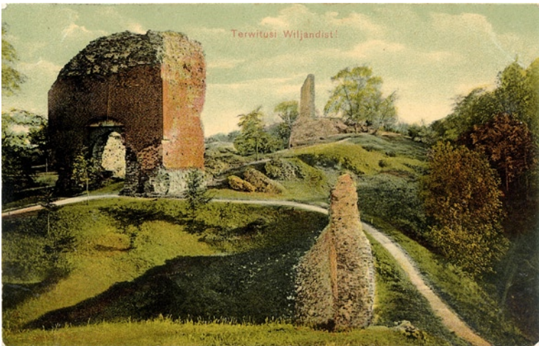
Kaevumägi, u 1910. a, H. Leoke (OB.K 120).