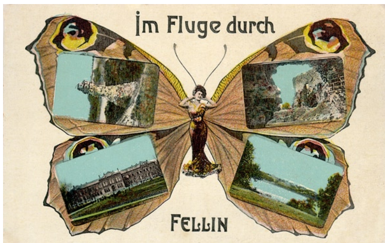
Viljandi vaated, u 1910. a, E. Ring (VM 4604 F 26/1087).