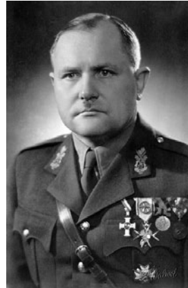
HENN VÄLME VR I/3

Autasumaa suurusega 19,89 hektarit eraldati mais 1923 Valgamaa Patküla valla Patküla mõisast. Kohta, mis sai nimeks Saluste talu, lasi