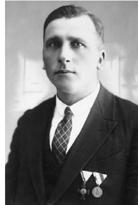
JOHAN ARJAK VR II/3

Vabaduse Ristile lisandusid 10 000 marka ja Vabadussõja Mälestusmärk. Sai maist 1920 Valgamaa Lõve mõisa Voorbahi karjamõisast 18,35-hektarise krundi. Ehitas Kullamäe taluks ristitud kohale hooned.