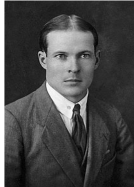
AUGUST KULL VR II/3

Tema nimi on veebruaris 2004 Tori kirikus avatud Teise maailmasõja ohvritena hukkunud Vabaduse Risti kavaleridele pühendatud mälestustahvlil.