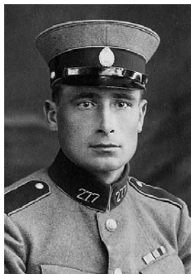
AUGUST LILL VR II/3

Töötas septembrist 1922 Tallinna politsei jalareservis kordnikuna, viidi oktoobris 1923 üle 6. jaoskonna kordnikuks. Murdis liiklusõnnetuse tagajärjel septembris 1924 jalaluu ning pärast pikemat aega kestnud ravimist lahkus politseiteenistusest. Töötas ametnikuna Tallinna linnavalitsuse majandusosakonnas. Oli Kaitseliidu Tallinna Maleva ja