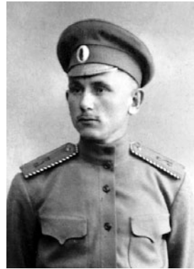
ADO TALUSSAAR VR II/3

Omandas 1929. aastal kesk- ja kutsekooli matemaatika-, füüsika- ja kosmograafiaõpetaja kutse. Töötas augustist 1929 augustini 1931 õpetajana Tartu tehnikagümnaasiumis, augustist 1931 augustini 1932 Tartu poeglastegümnaasiumis, jaanuarist 1932 augustini 1933 Tartu tööstus- ja majandusõpilaste koolis ning augustist 1932 augustini 1933