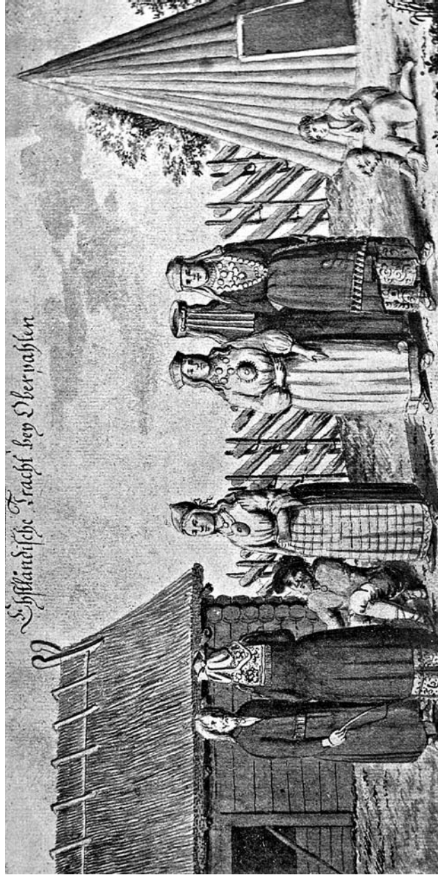
C. M. v. Lilienfeld / J. Chr. Brotze akvarell Eesti rõivad Põltsamaa ümbruses 1777 . Foto E. Selleke 1942, ERM Fk 668: 31.