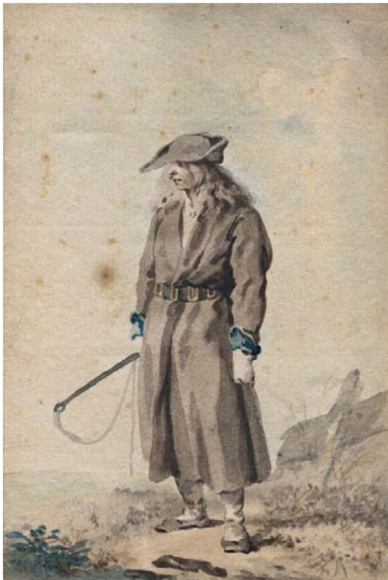
Gottlieb Welte akvarell „Eesti mees“. EAM G 3739.