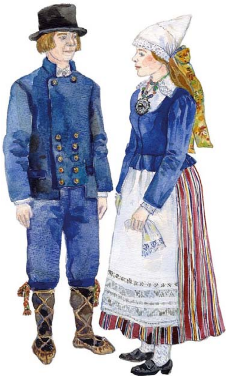
Põltsamaa mees ja naine 19. sajandi keskel. Joonistanud Mare Hunt.