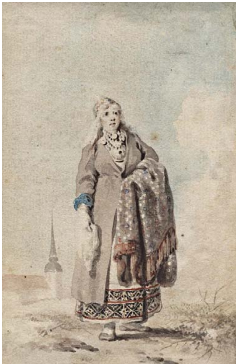
Gottlieb Welte akvarell „Eesti talunaine“. EAM G 971.