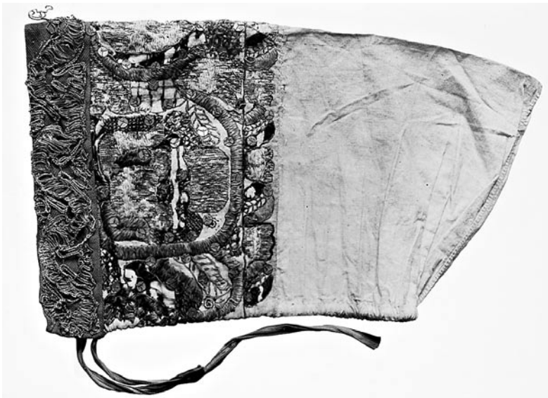
Põltsamaa lilltanu. Foto E. Selleke 1939. ERM Fk 839: 8.

Tüüpiliseks Põltsamaa naise peakatteks 18. sajandil ja 19. sajandi I poolel ning keskpaiku oli valgest linasest labasest riidest pika sopiga tanu – püsttanu . See moodustati püstsüunas kahekorra murtud ristkülikukujulisest riidetükist, mille murrukoht jäi ette, servi ühendav õmblus pealaele. Esiäärde õmmeldi 3,5–4,5 cm laiune niplispits või võrkpits. Mõnikord vooderdati pits punase siidpaelaga. Pähe köideti