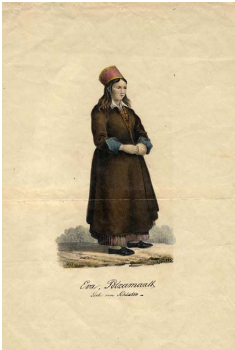
Georg Friedrich Schlateri lito „Eva Pöözamaalt“. ERM EJ 79: 5.