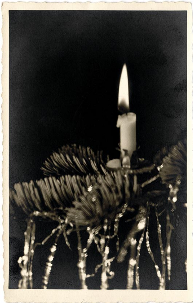
Hilja Rieti kunstiline postkaart (lk 36–46). Tabel 1, teema 4.