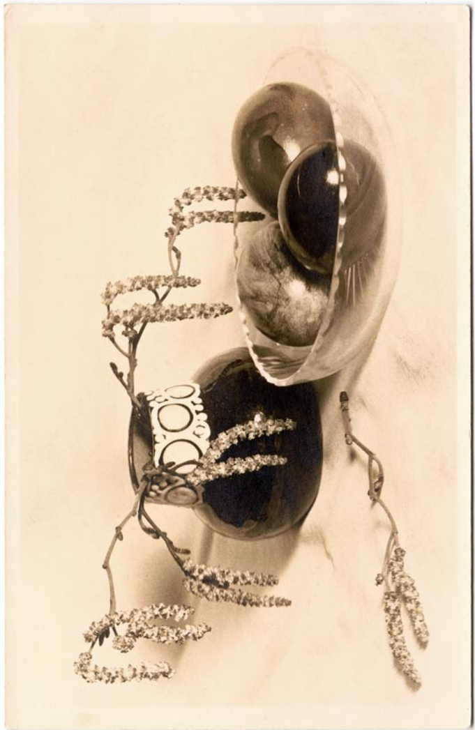
Hilja Rieti kunstiline postkaart (lk 36–46). Tabel 1, teema 7.