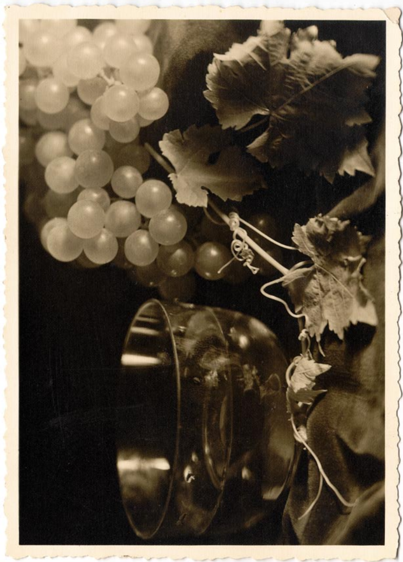
Hilja Rieti kunstiline postkaart (lk 36–46). Tabel 1, teema 31.