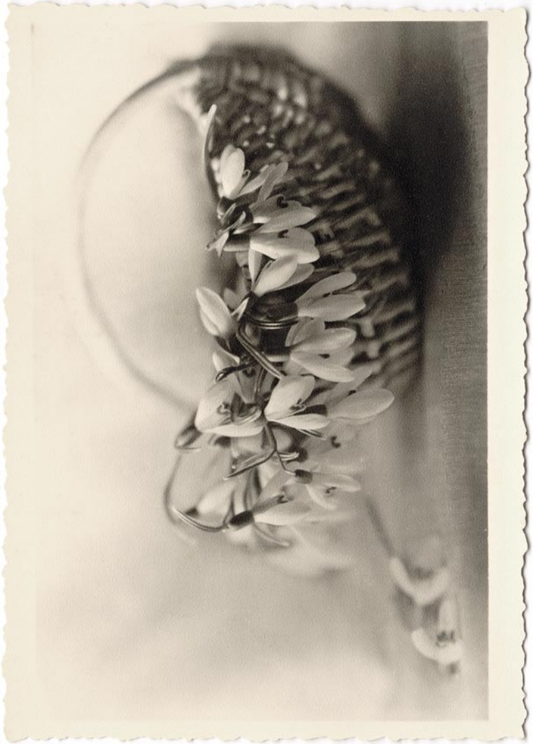
Hilja Rieti kunstiline postkaart (lk 36–46). Tabel 1, teema 2.