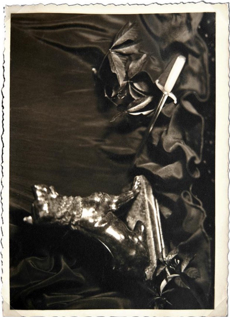
Hilja Rieti kunstiline postkaart (lk 36–46). Tabel 3, teema 2.