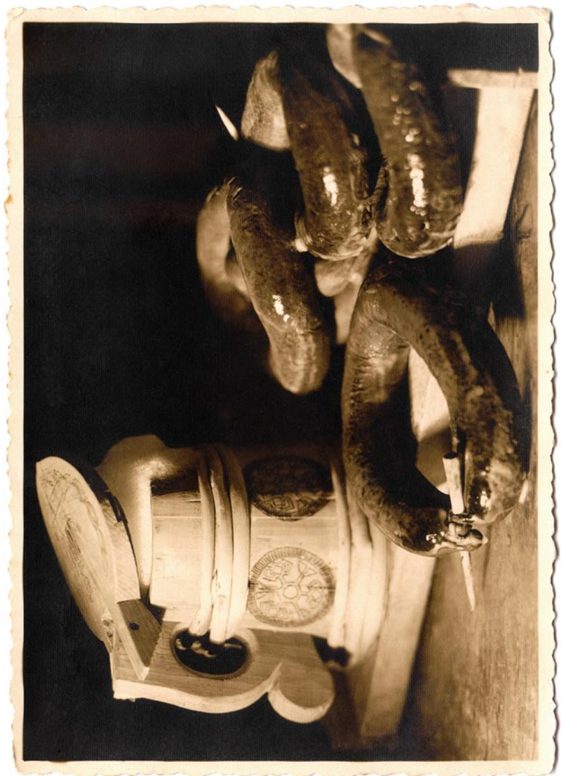
Hilja Rieti kunstiline postkaart (lk 36–46). Tabel 1, teema 1.