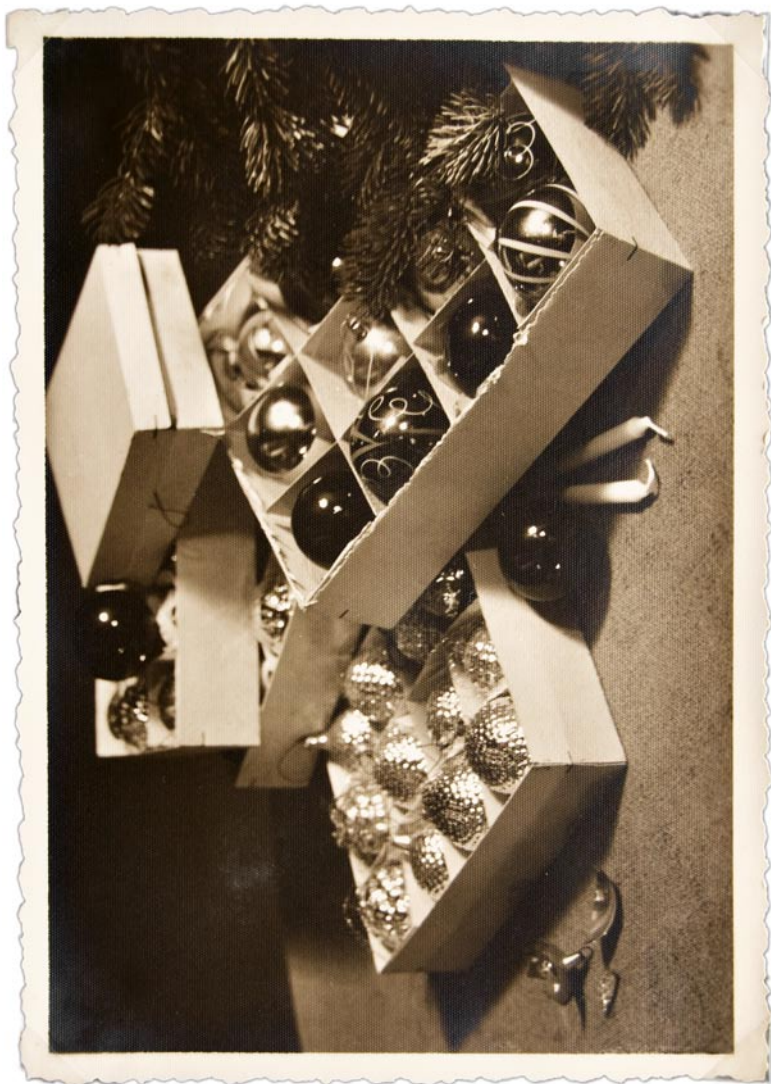
Hilja Rieti kunstiline postkaart (lk 36–46). Tabel 3, teema 1.