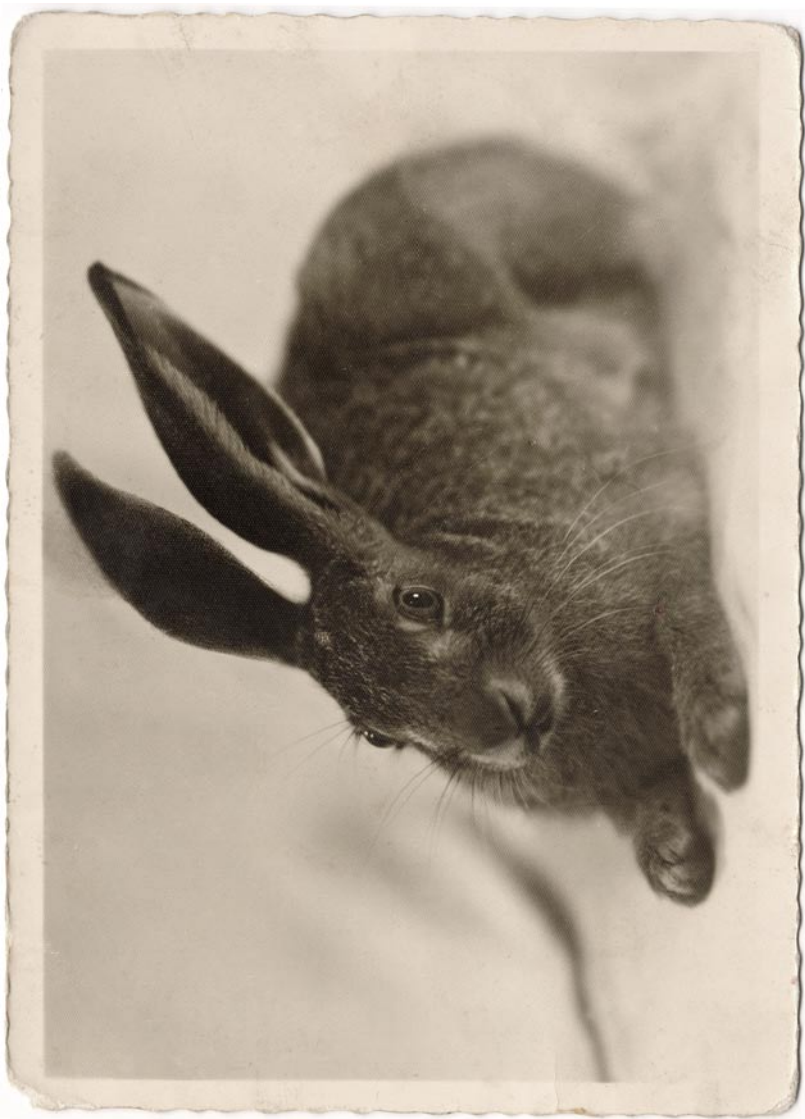
Hilja Rieti kunstiline postkaart (lk 36–46). Tabel 1, teema 8.