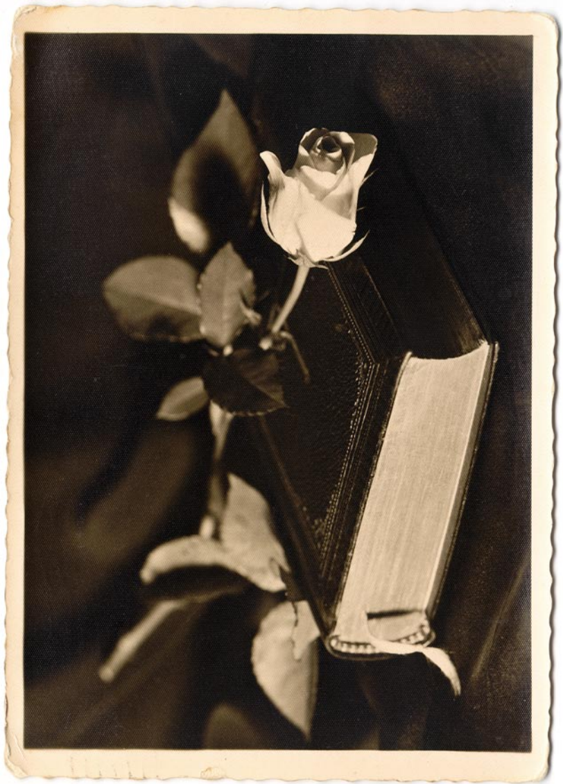
Hilja Rieti kunstiline postkaart (lk 36–46). Tabel 1, teema 3.