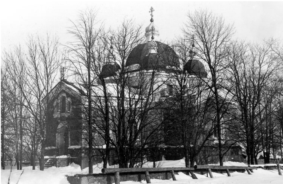
Arusaare õigeusu kirik 1931. a.