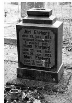
Jüri Ehrbergi haud Pilstveres.

EELK Pilstvere koguduse sünnikanne nr 39/1897; EELK Pilstvere koguduse personaalraamat XIV. A–K. 1910–1940; EELK Pilstvere koguduse surmakanne nr 43/1919; ERA.542.1.1.L.180 (surm); ERA.542.1.5.L.210 (surm); ERA.680.3.653 (teenistusleht).