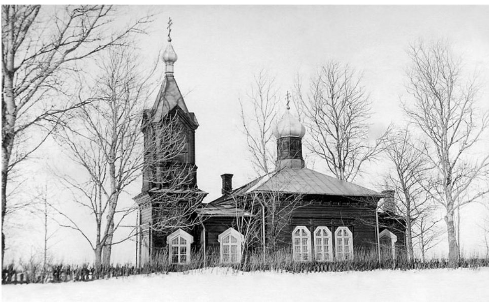
Kikevere õigeusu kirik Lõimetsas.

kuid purustati lõplikult sügisel 1945 Nõukogude okupatsioonivõimu korraldusel. Taasavamine sai teoks 28. juulil 1991 jällegi ilma sõdurikujuta, selle asemele paigutati Vabaduse Rist. Samba külgedel on metallplaadid langenute nimedega. Need on originaalid, mis olid ligi pool sajandit varjul Viljandimaa teises otsas, Tarvastu kandis. Plaatidel on 54 langenu nimed.