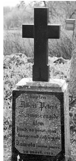
Albert Petersi VR II/3 haud Pilstveres.