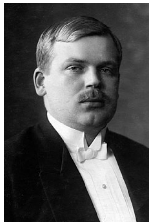
Riigitegelane Jüri Vilms VR III/1.