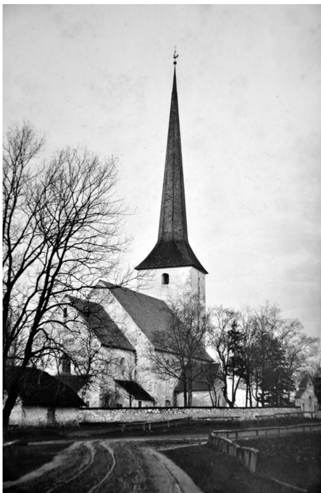
Pilistvere kihelkonna kirik enne 1905. a sügist.

Seni mahajäänud piirkond arenes jõudsalt 20. sajandi algul. Seda soodustas Tallinna–Viljandi kitsarööpmelise raudtee valmimine 1900. aastal ning Võhma majanduskeskuseks kujunemine.