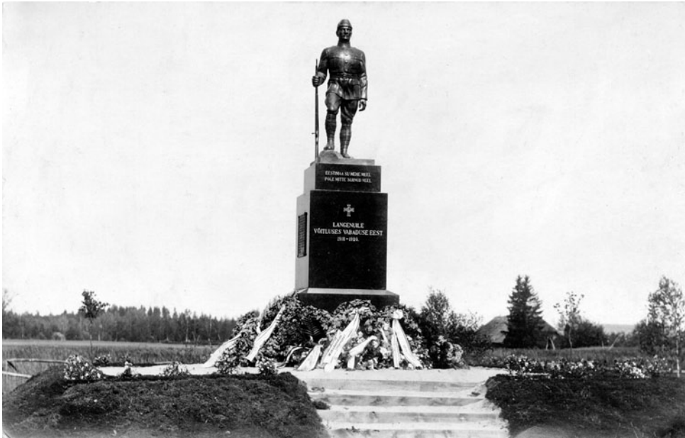
Pilistvere kihelkonna Vabadussõjas langenute monument 1931. aastal pärast avamist.