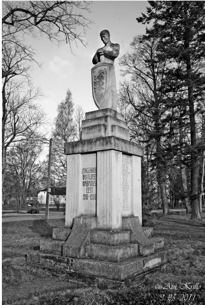
Põltsamaa kihelkonna Vabadussõjas langenute monument 2011. aastal.