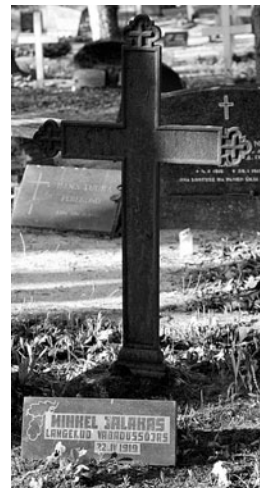
Mihkel Jalakase VR II/3 haud Põltsamaal.