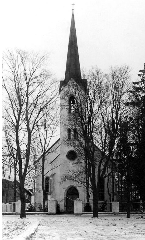
Risti kirik Käsukonnas.

Kohalik rahvas ei unustanud oma Vabadussõjas elu kaotanud poegi. Keskse monumendina avati 26. juulil 1931 Pilistvere asulas üpris kiriku juures kihelkonna langenuate mälestussammas. Kohalikud kommunistlikud tegelased lammutasid monumendi juba 19. augustil 1940. Sammas püstitati taas ilma pronksist sõdurikujuta 12. juulil 1942,