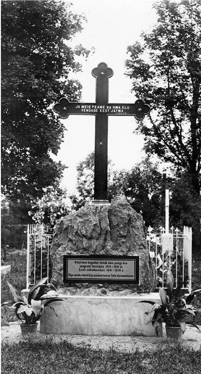
Pilistvere kihelkonna Esimeses maailmasõjas ja Vabadussõjas langenute mälestusrist.

kirikus, Tartu Jaani kirikus, Vabariigi Ohvitseride Keskkogu saalis Tallinnas ning 1. jalaväerügemendi langenutele Narva ohvitseride kasiinos ja 7. jalaväerügemendi langenutele Võru ohvitseride kasiinos pühendatud tahvlitel olid Pilistvere meeste nimed.