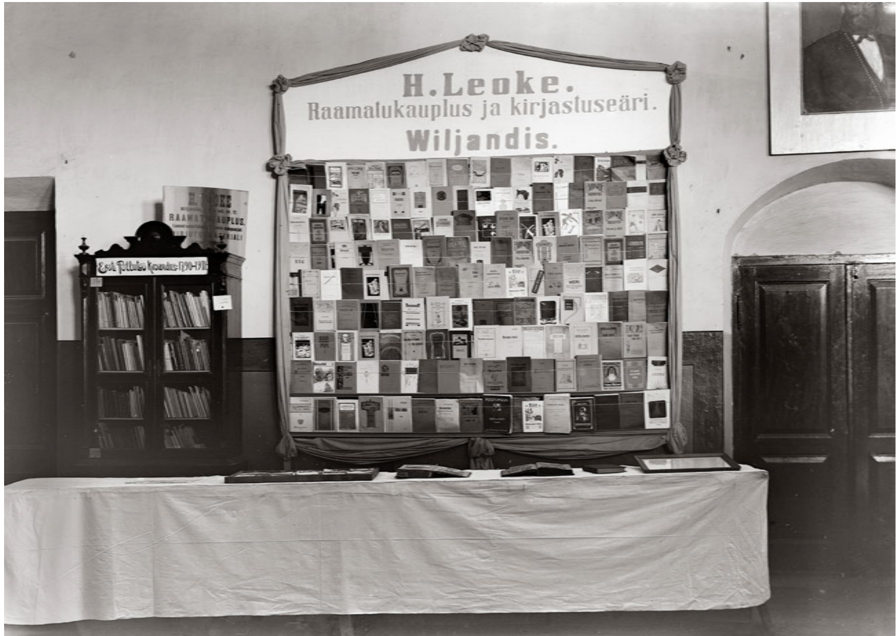
Hans Leokese raamatulett 1911. aasta Viljandi põllumajandusnäitusel. Foto J. Riet, VMF 424:330